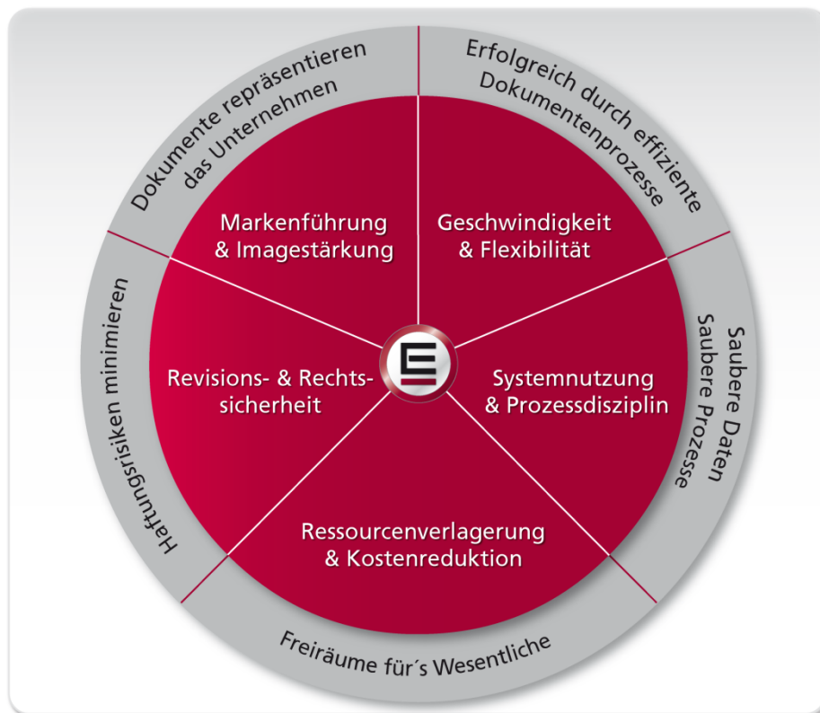
Schaubild: Übergeordnete Hebelwirkungen der ESCRIBA Dokumenten- und Prozesstechnologie